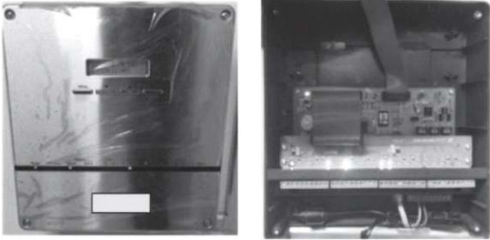
<그림 1-2> NTP 취약점을 이용, DDoS 공격에 악용된 냉난방 셋탑박스

이에 본 가이드에서는 NTP 서비스의 주요 취약점에 다루고, 해당 취약점에 대한 점검 항목 및 대응책을 제공함으로써 사고를 예방하고 발생할 수 있는 피해를 최소화하고자 한다.